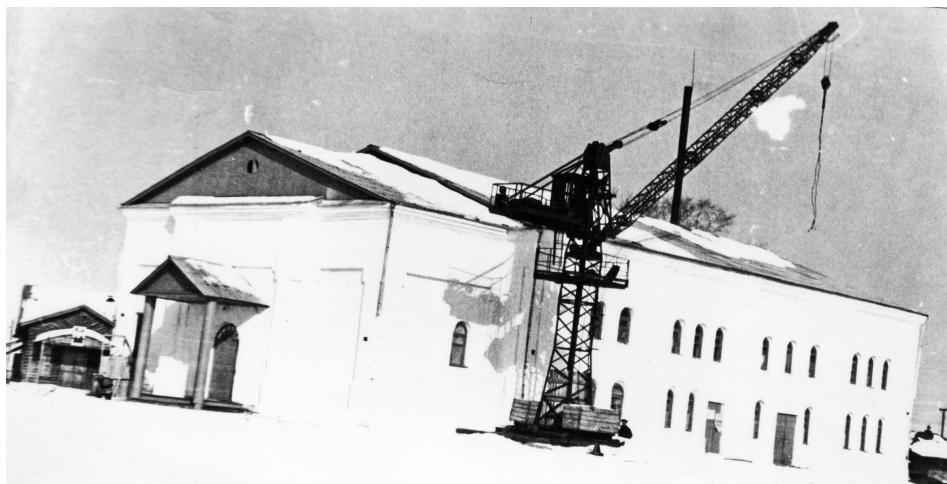
1967 год: строительство ДК подходит к концу.

Согласно источнику, в составе ляпуновского прихода было 11 деревень: Инишева, Малая Серкова, Большая Серкова, Дрянная (нынешняя Заречная), Большая Койнова (или Зырянская), Малая Койнова (или Кобылинская), Крутикова, Сарайка,