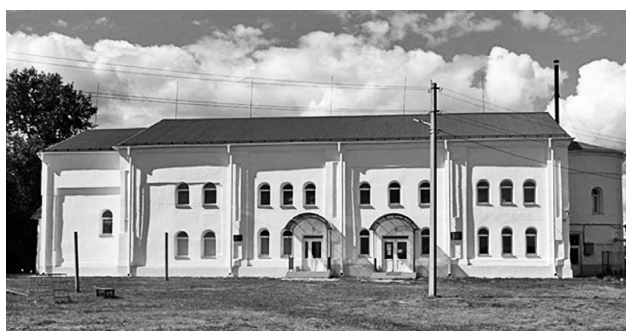
Внешний вид Ляпуновского Дома культуры напоминает о прошлой эпохе.