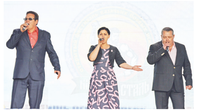
Вокальное трио «Кристалл».