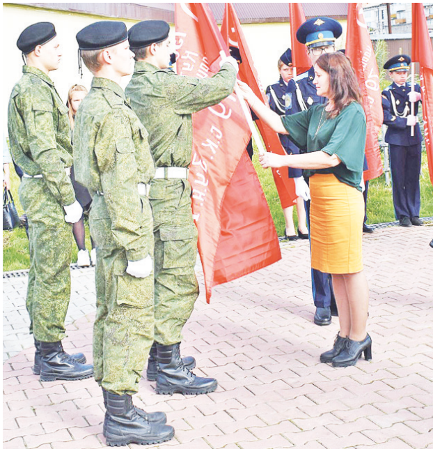
Ученики Краснополянской СОШ были приглашены на патриотическую акцию «Знамя Победы».

В торжественной церемонии приняли участие представители администрации Восточного управленческого округа, руководители Ирбитского муниципального образования, управления культуры, ветеранских организаций, школьники из 13 муниципальных образований. Обращаясь к собравшимся, выступающие напомнили, что 2020 год проходит под знаком 75-летия Победы советского народа в Великой Оте-