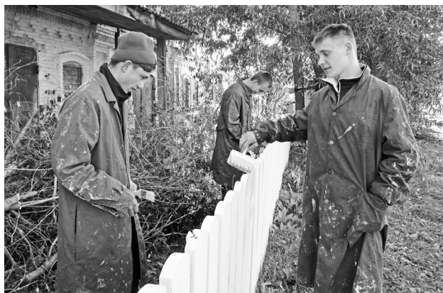
Учащиеся из Байкаловского филиала Слободотуринского аграрно-экономического техникума покрасили забор возле музея.

Кроме того, в начале учебного года музей становится площадкой для практикума учащихся из